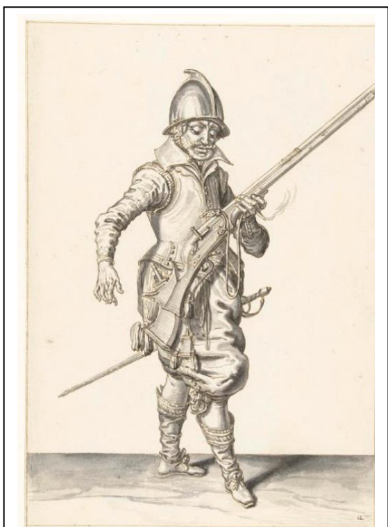
Huursoldaat uit Nederland

en de kruidnagelaanplant op Hoamoal vernietigen. In 1625 deden ze een eerste aanval op Hitu, Hatuhaha, Ihamahu (op Saparua) en Hoamoal. Ze richtten grote verwoestingen aan, maar ze konden de forten in het binnenland niet veroveren. Ook het fort op de berg Alaka (op Haruku) wist de aanval af te slaan. De Nederlanders hadden dus wel bewezen dat ze veel sterker waren, maar uiteindelijk hadden ze geen resultaat geboekt.