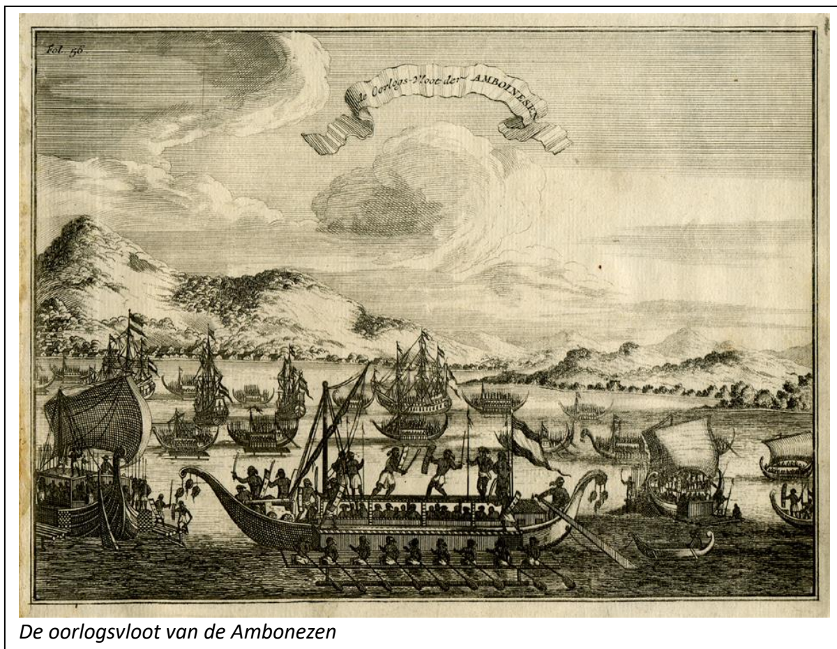
De oorlogsvloot van de Ambonezen

door Hitu, en de Portugezen. Toen de eerste Nederlanders kwamen, dacht de bevolking van Hitu dat het verstandig was hen als bondgenoot te hebben tegen de Portugezen. De Portugezen probeerden zich tegen de Nederlanders te verzetten, maar in 1605 kwam Steven van der Haghen terug met een vloot van tien schepen en nam het Portugese fort op Ambon in. Daarna zeilde hij door langs alle plaatsen, die Portugees bezit waren. Zo kwamen de christelijke zuidelijke delen van Ambon, Haruku, Saparua en vrijwel geheel Nusalaut in Nederlandse handen.