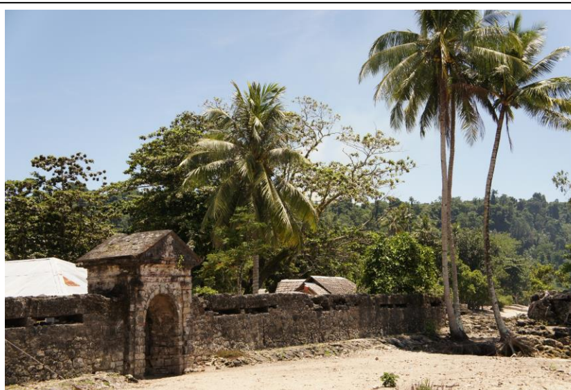
Restanten van fort Zeelandia op Haruku

En zo verloor Hatuhaha zijn zelfstandigheid.