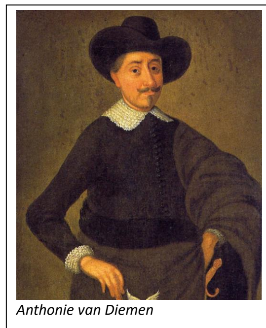
Anthonie van Diemen

Toen Van Diemen met zijn schepen en soldaten op Ambon aankwam, heeft hij eerst Hitu onderworpen. Daarna is hij verder gevaren om de plaatsen waar het verzet het zwaarst was te veroveren: Hatuhaha, Ihamahu en Hoamoal. Eerst voer hij van Ambon naar Haruku met ruim duizend soldaten. Ze gingen aan land bij Kabau, dat verlaten bleek.