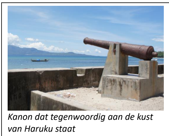
Kanon dat tegenwoordig aan de kust van Haruku staat

De bewapening van de bewoners van Haruku bestond meestal uit schild en zwaard. Daarnaast hadden ze geweren, die ze van Europeanen hadden gekocht. In Hatuhaha vertelt men dat er ook drie kanonnen waren, waarvan maar twee wilden schieten. En dat kan kloppen, want uit Java werden soms kleine kanonnen aangevoerd. Als kogels werden volgens het verhaal kokosnootdoppen gebruikt.