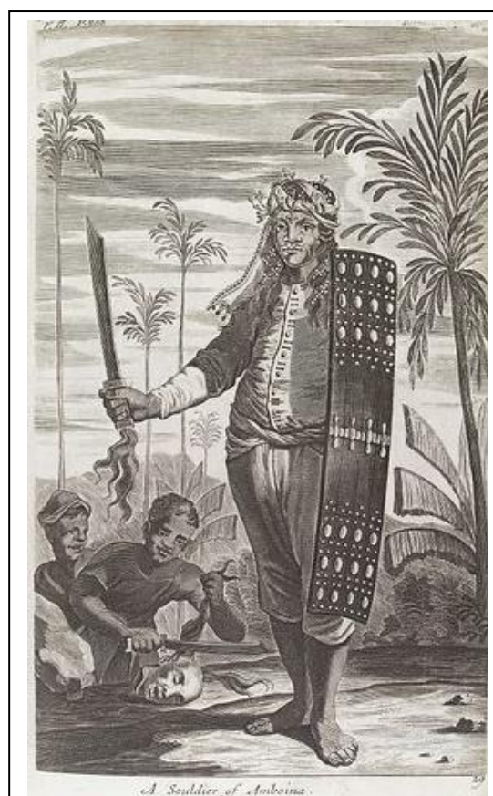
A Soldier of Amboina

Veel dorpen op de eilanden van de Molukken hadden bondgenootschappen met elkaar gesloten. Op Haruku bijvoorbeeld de islamitische dorpen van Hatuhaha, het noordelijk deel van het eiland. Ze hadden samen een fort op de berg Alaka. In deze benteng konden ze zich in tijd van nood terugtrekken. Ook hadden ze één of meerdere kora-kora (oorlogsprouwen), waarmee overvallen in het gebied van een tegenstander konden