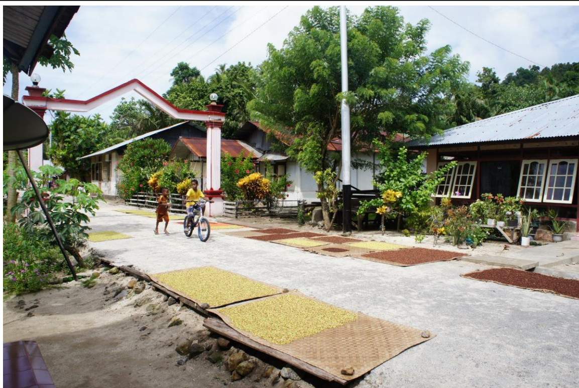
Kruidnagels liggen te drogen op matten