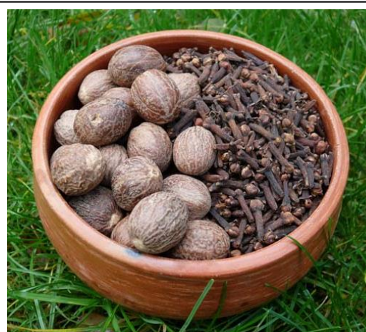
Nootmuskaat en kruidnagel

In de Middeleeuwen voeren ieder jaar zo'n zes schepen, meestal vanaf Java, naar de Molukken om kruidnagels en andere producten als nootmuskaat en paradijsvogels te kopen.