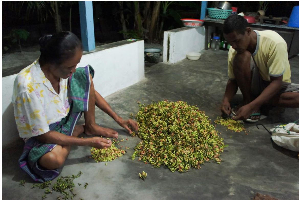
De steeltjes van de bloemknoppen (kruidnagels) worden verwijderd

Nog steeds is de verbouw van de kruidnagels één van de belangrijkste bronnen van inkomsten van de bewoners van Molukken. Het geld dat ze hiermee verdienen, is vaak bestemd voor extra uitgaven (school, dokter) of voor luxeproducten.