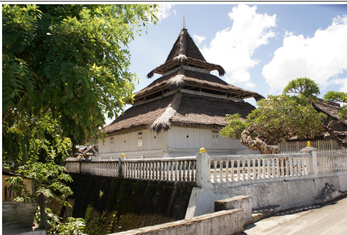
Moskee van Rohomoni

Ook verbaas je je er misschien over, dat Hulaliu christelijk is. Het hoorde immers bij het bondgenootschap van Hatuhaha, dat