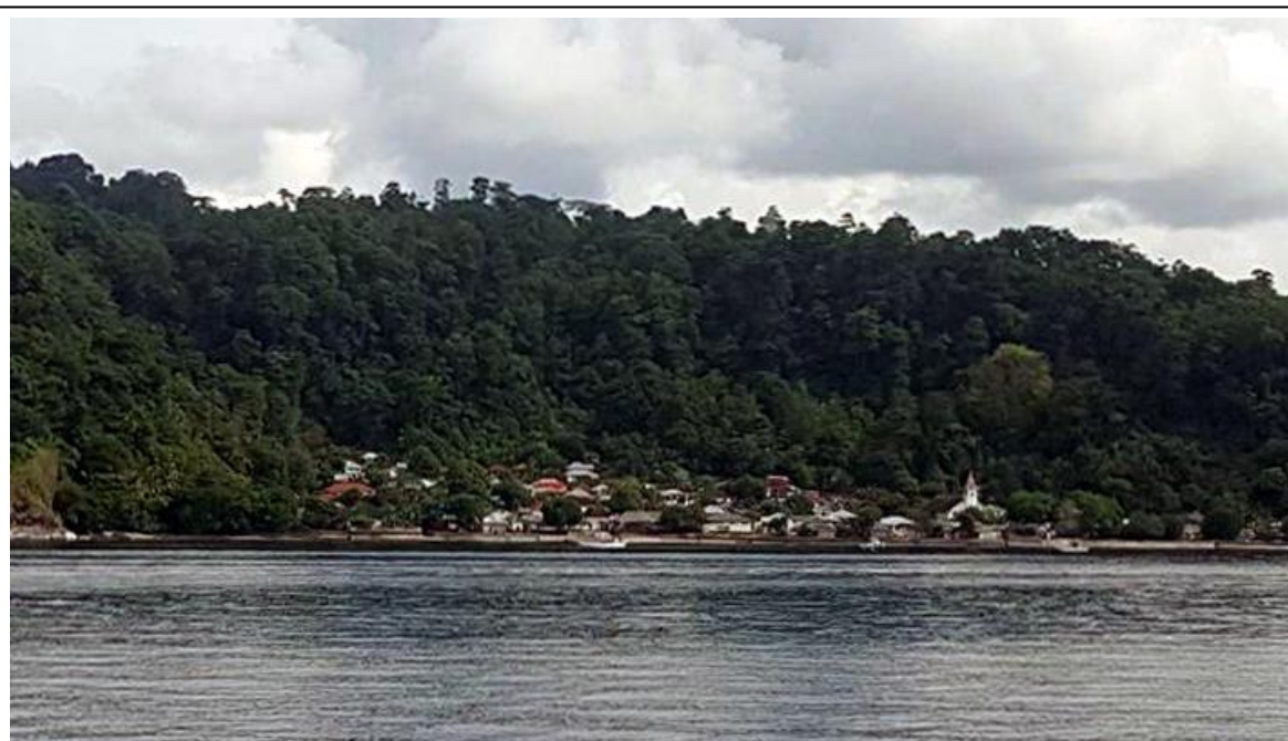
De kust van Haruku met het dorp Oma

Wanneer je met de boot van Ambon naar Haruku vaart, zie je al van verre de met tropisch regenwoud bedekte bergen oprijzen. Wanneer je dichterbij komt, kun je aan het strand huizen zien. Bij grote dorpen lijkt het wel alsof ze bovenop elkaar staan. Daar zie je boven de huizen de kerk of moskee uitsteken. Zo is het tegenwoordig, maar hoe zag Haruku er uit in de tijd van de Alaka-oorlog? Wat was hetzelfde en wat anders?