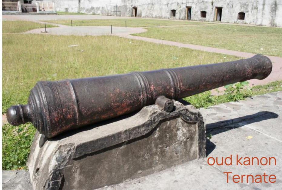
oud kanon Ternate

‘De gevechten zijn hevig en het aantal doden is aanzienlijk. Aan beide zijden. Maar ze komen er niet doorheen, de aanvallen zijn gestopt. Onze verdediging heeft goed werk verricht.’