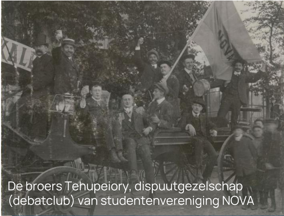
De broers Tehupeiry, dispuutgezelschap (debatclub) van studentenvereniging NOVA