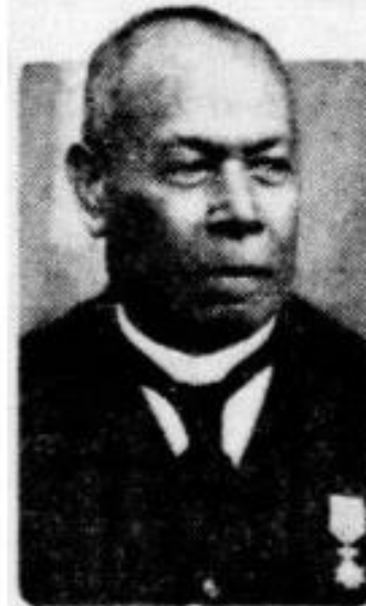
Wjlen ds. Thenu.

Het was een indrukwekkende plechtigheid, die besloten werd met een defilé van de de verschillende deputaties. — (Aneta).