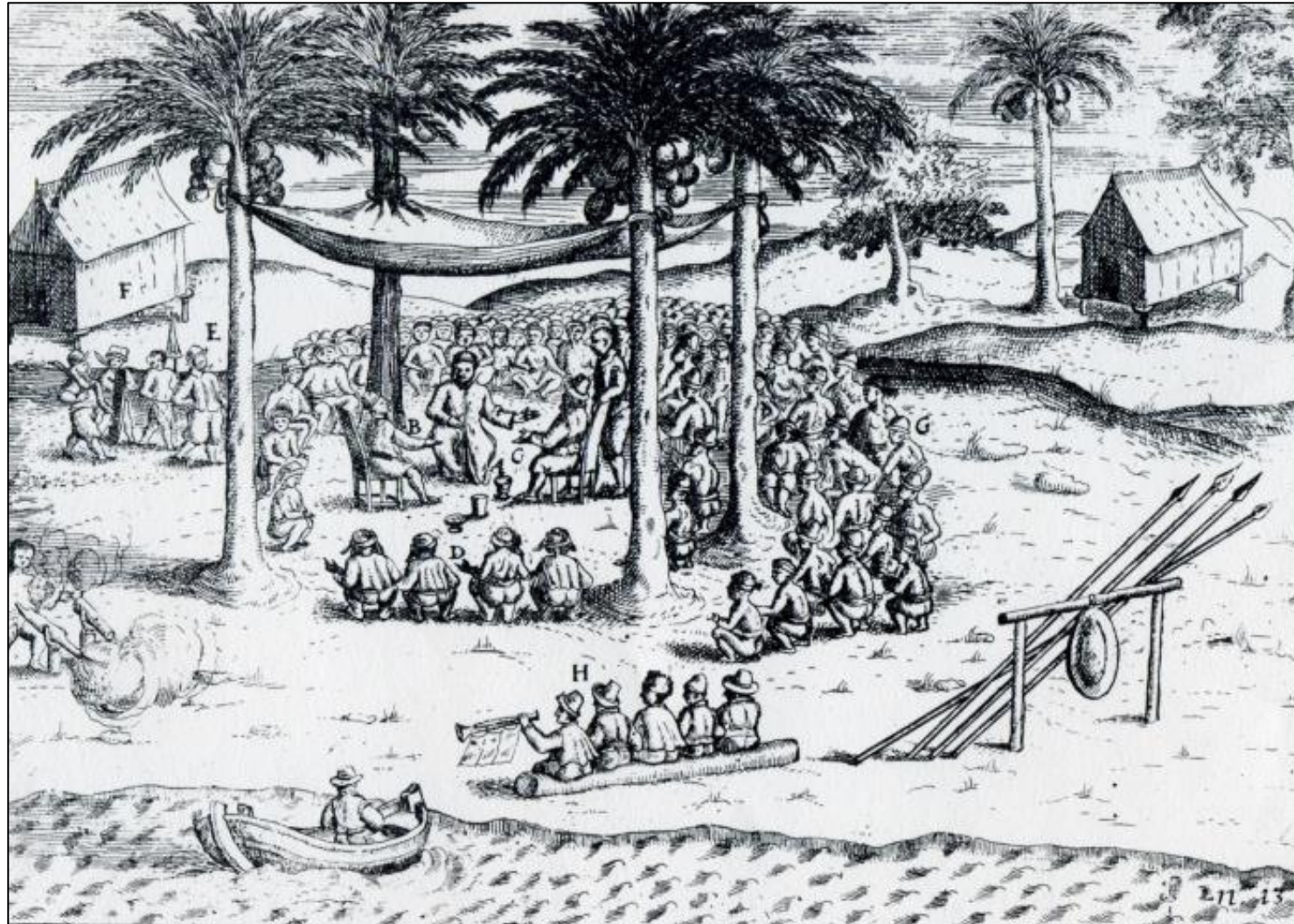
Onderhandelingen tussen Nederlanders en Hituezen, maart 1599

Nederlanders verkopen en niet aan andere handelaren. Maar dat contract was een blok aan het been van de vorsten van Hitu.